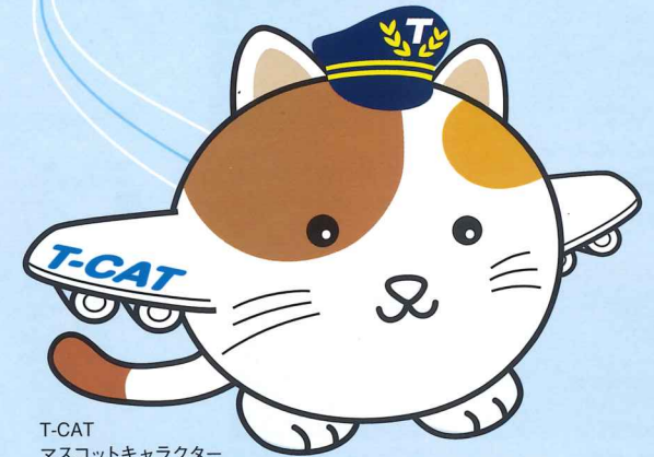
T-CAT マスコットキャラクター 「またたびくん」